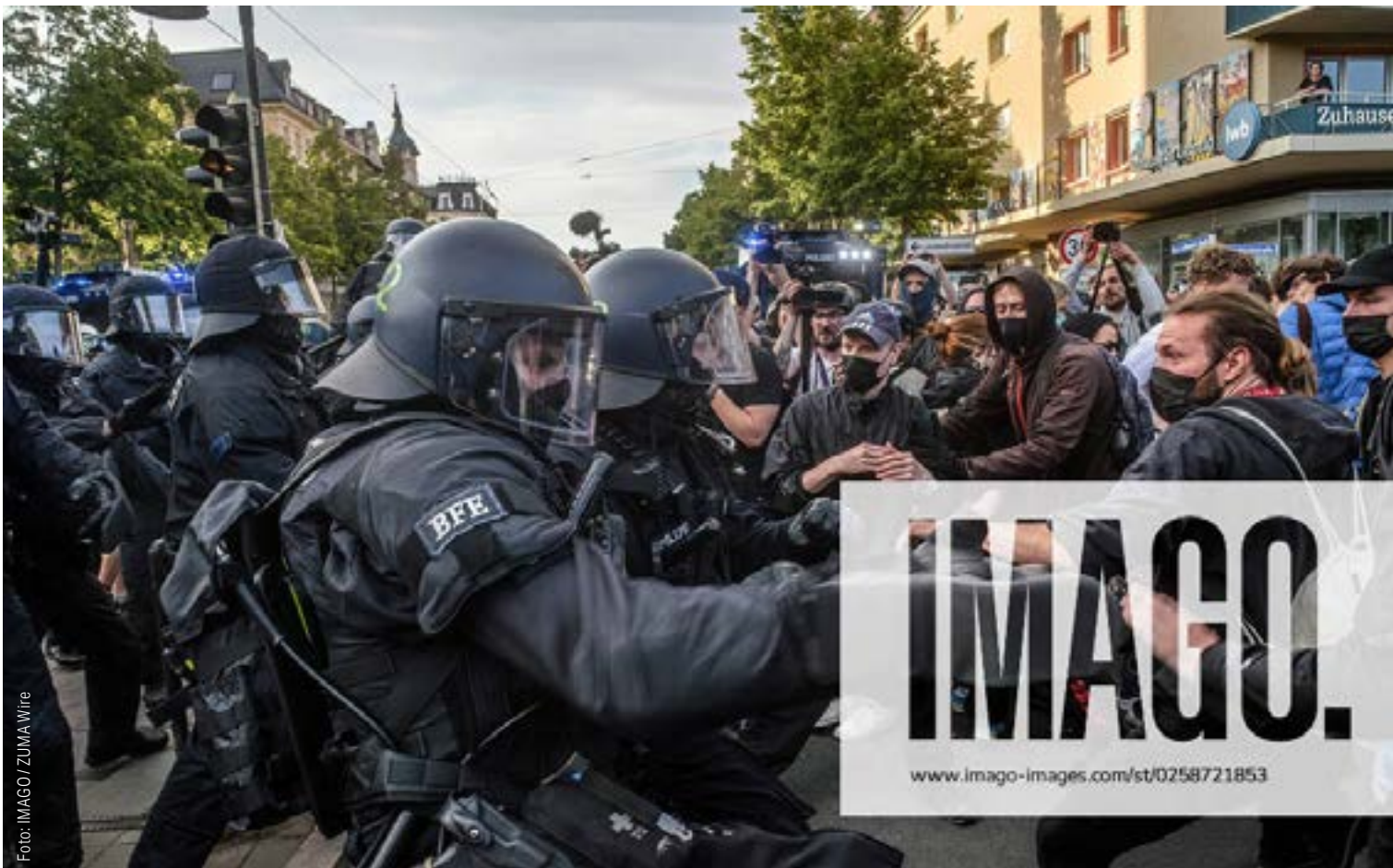
Nach dem Urteil im „Hammerbände“-Prozess hatte die Polizei im Zuge der linksextremen „Tag X“-Proteste alle Hände voll zu tun.

do it again!“, der zeitgenössische Vizekanzler Habeck konnte nach eigenen Aussagen „noch nie etwas mit Deutschland anfangen und fand Vaterlandsliebe stets zum Kotzen“. Die Beispiele ließen sich hundertfach fortsetzen. Woher kommen diese Selbstaggressionen, die vom Kölner Soziologen Erwin Scheuch einmal als „Rassismus nach innen“ charakterisiert wurden? In anderen Ländern kennt man diesen Selbsthass gegen die eigene Nation nicht, warum bei uns?