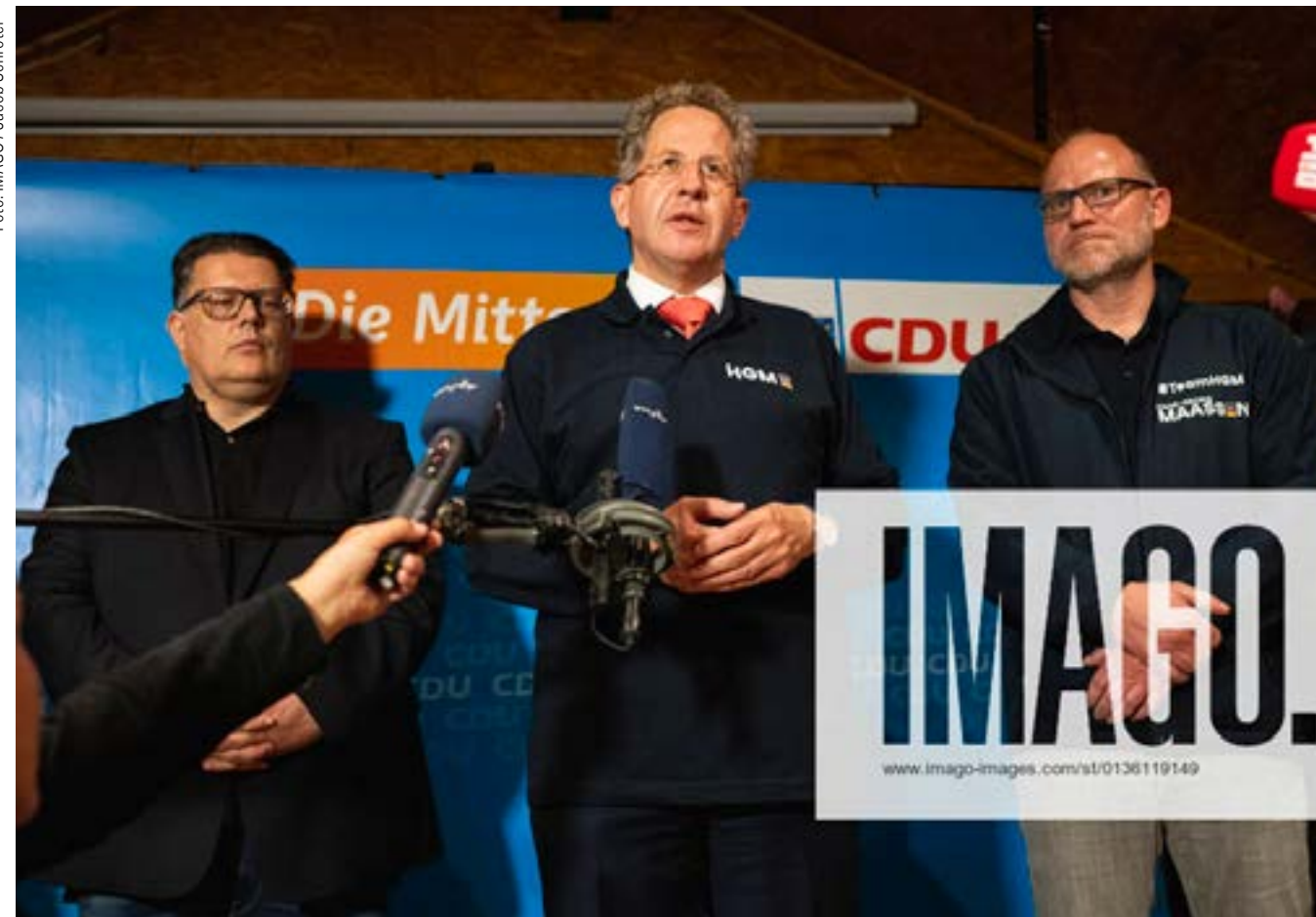
2021 trat Maaßen für die CDU zur Bundestagswahl an, konnte in seinem Wahlkreis allerdings kein Direktmandat holen und verpasste deshalb den Einzug ins Parlament.

öffentlich-rechtlichen Medien ihrem gesetzlichen Auftrag, wahrhaftig und in aller Breite zu berichten und zu kommentieren, nicht mehr nachkommen. Leider sieht der Medienstaatsvertrag, genauso wie die Medien- oder Rundfunkgesetze der Länder, keine Sanktionsregelungen vor, wonach Verstöße dagegen auch Folgen für die Intendanten und Chefredakteure hätten. Normalerweise werden derartige Verpflichtungen auch neben-straftrechtlich geregelt. So etwas gibt es jedoch in unserem Rundfunksystem nicht und wo kein Kläger, da kein Richter, und wenn keine Strafnorm gegeben ist, dann setzen sich die Leute einfach darüber hinweg.