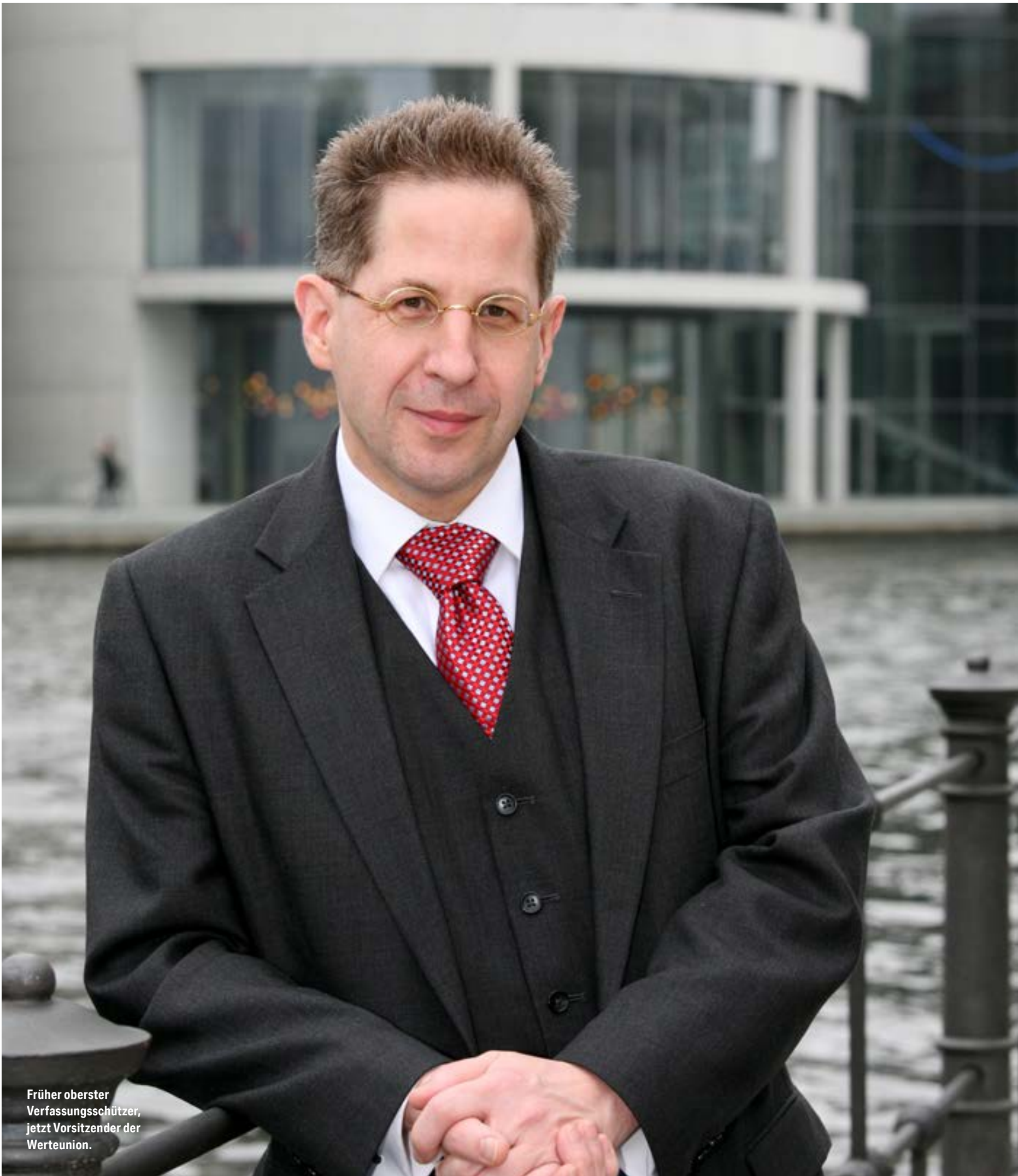
Früher oberster Verfassungsschützer, jetzt Vorsitzender der Werteunion.