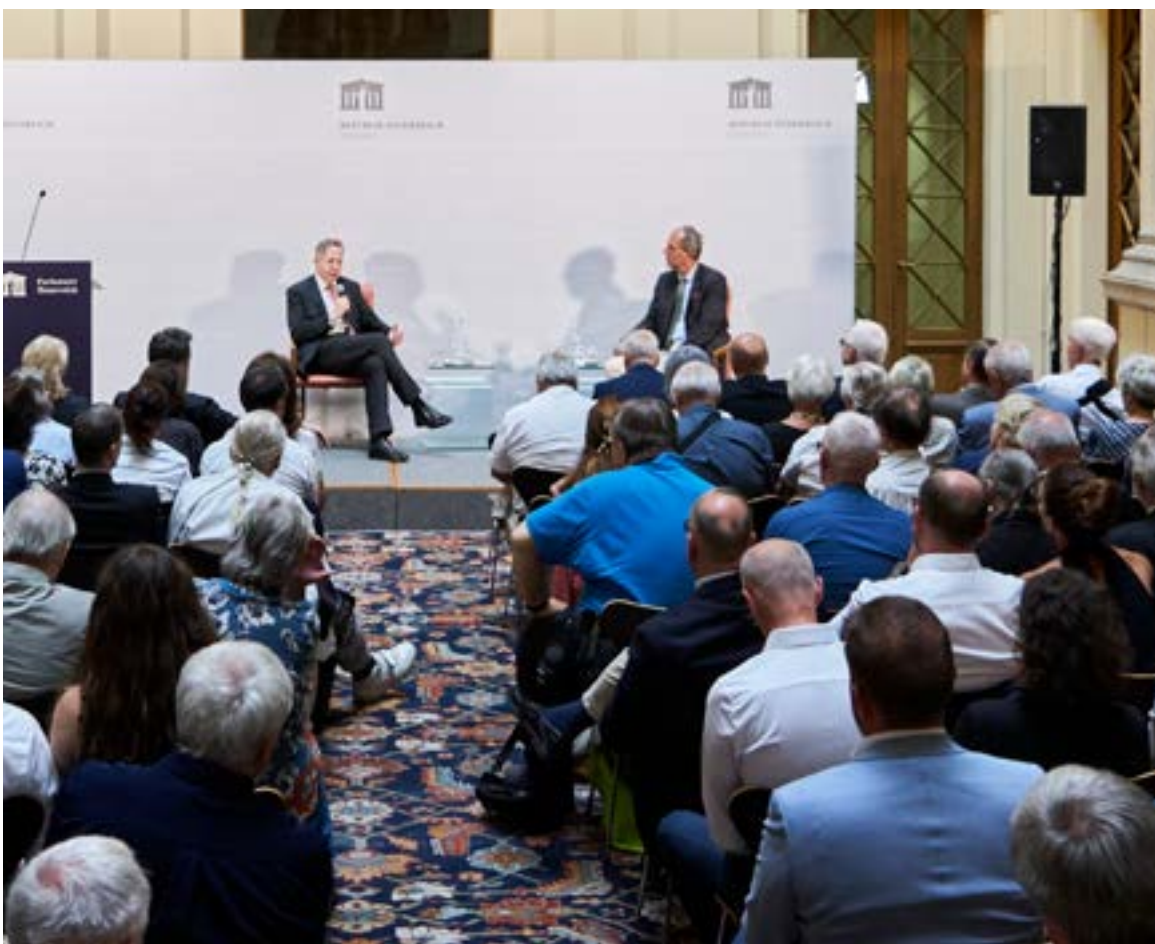
Hans-Georg Maaßen (li.) im Gespräch mit Johannes Hübner (re.).