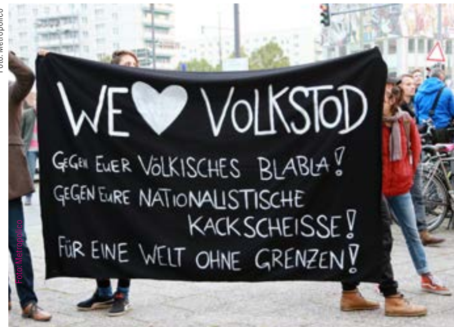
Die radikale Linke würde Deutschland am liebsten sofort abschaffen.

„Der Rassismus gegen Weiße und Deutsche, kurz gegen das ‚Eigene‘, ist eine sehr deutsche Spezialität.“